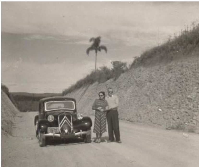
Kurze Rast auf der Reise Curitiba – Rio de Janeiro 1952

Nach endlos scheinenden Stunden zügiger Fahrt auf staubiger Naturstrasse tauchte am Horizont endlich die Gebirgskette auf, die wir zu überqueren hatten. Auf der anderen Seite sollten wir dann in den Bundesstaat Sao Paulo gelangen, wo weit bessere Strassenverhältnisse erwartet werden durften.