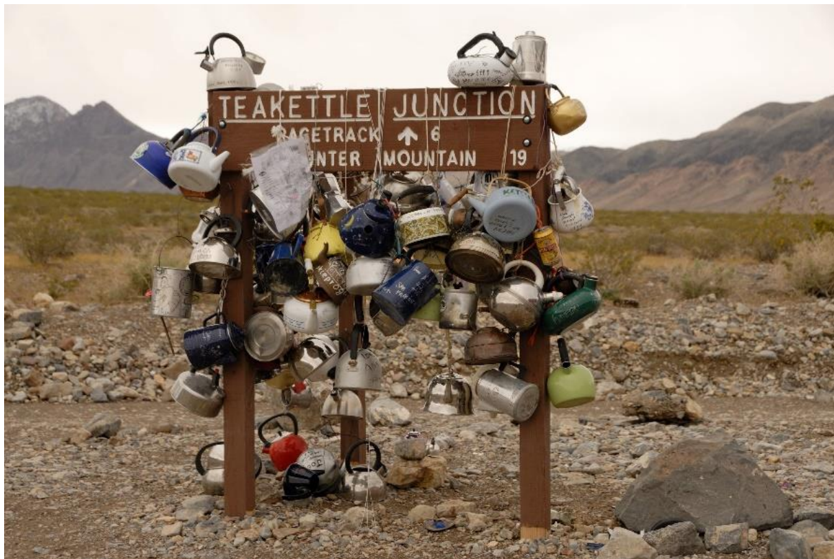
Vor langer Zeit begonnene Tradition - alte Teekannen werden von Besuchern an der sogenannten Teekannen Wegkreuzung hinterlassen (ca. 10 km vor der Racetrack Playa).